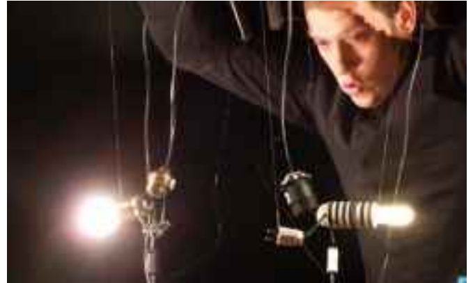
C'est la guerre des lumières entre Monsieur Watt et la lampe à économie d'énergie.

M. Watt est une ampoule classique, vissée dans une lampe posée sur une table de chevet. Quand le vieil homme est levé, M. Watt peut aller vivre sa vie.