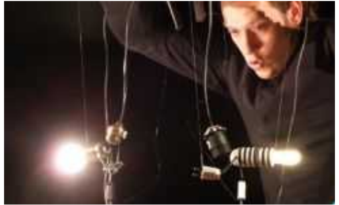
C'est la guerre des lumières entre Monsieur Watt et la lampe à économie d'énergie.

Lire calmement avant de se coucher, lové sur son oreiller-porte-lunettes et dans sa couette-mouchoir. Vibrer de tout son filament lors de la finale de la coupe du monde de foot. Mais voilà que le vieil homme ramène une autre ampoule, une lampe économique. Une perturbatrice dans son monde si parfait. La guerre est déclarée, les éclairs de lumière font rage. Avant de claquer toutes les deux... et de faire rire aux éclats la bonne vieille bougie. Mêlant mime, marionnette et masque, cette petite forme de spectacle est un rayon de soleil pour tous les âges. Une fable poétique sur ce que l'innovation ne pourra jamais remplacer.