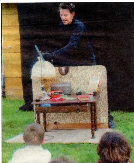
M. Watt a mis en évidence les problèmes de surconsommation et d'énergie dans son spectacle de marionnettes