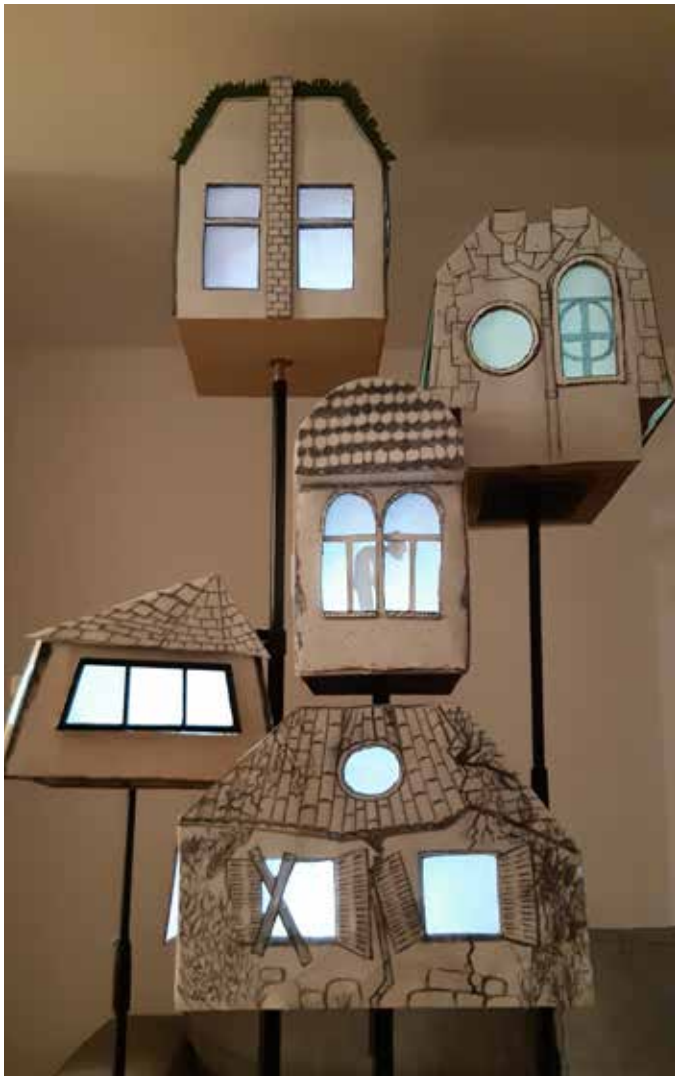
prototype de décor

Pour les scènes d'intérieur , un élément de décor par personnage permettra de s'inviter rapidement chez chacun. 2 espaces de manipulation sont prévus, un à cour et un à jardin, pour permettre des changements de décor mais aussi des scènes en simultané.