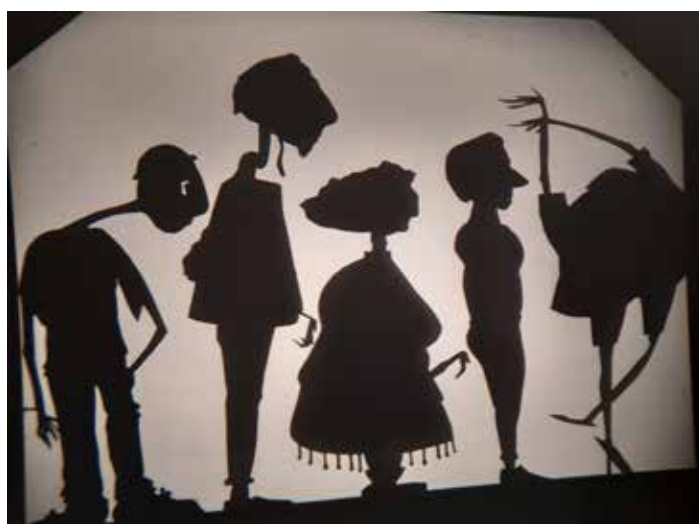
galerie de personnages, silhouettes au retroprojecteur

L'injonction au bonheur, la tyrannie de l'optimisme, l'obsession égocentrique de l'amélioration de soi nous détournent des efforts nécessaires pour transformer la société... et pourquoi pas le futur !