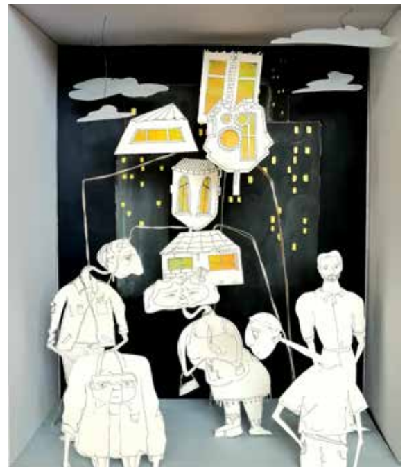
Croquis personnages et scénographie

Et pour finir Balthazar , nouvel arrivant dans ce microcosme gouverné par des règles tacites qu'il va tenter de comprendre mais ses questionnements sur le bonheur vont bousculer le fragile équilibre qui régnait.