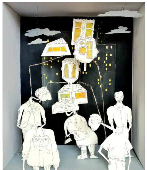
Croquis personnages et scénographie

Et pour finir Balthazar , nouvel arrivant dans ce microcosme gouverné par des règles tacites qu'il va tenter de comprendre mais ses questionnements sur le bonheur vont bousculer le fragile équilibre qui régnait.