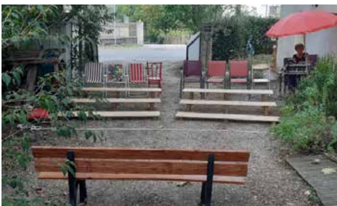
Test d'installation pour une petite jauge dans un jardin.