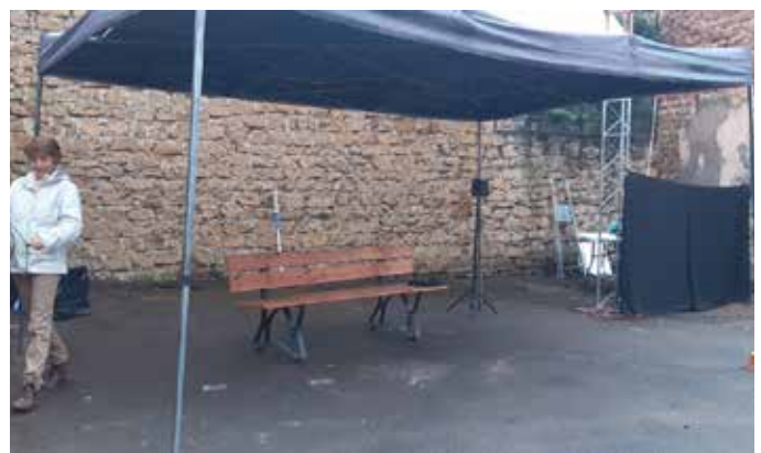
La compagnie peut fournir une tonnelle permettant de maintenir la représentation en cas de petite pluie.