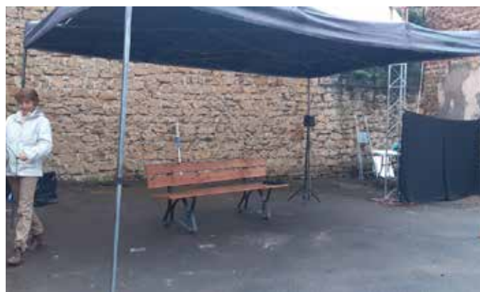
La compagnie peut fournir une tonnelle permettant de maintenir la représentation en cas de petite pluie.