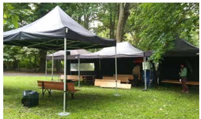
La compagnie peut fournir une tonnelle permettant de maintenir la représentation en cas de petite pluie. Nous ne possédons pas de tonnelle pour le public